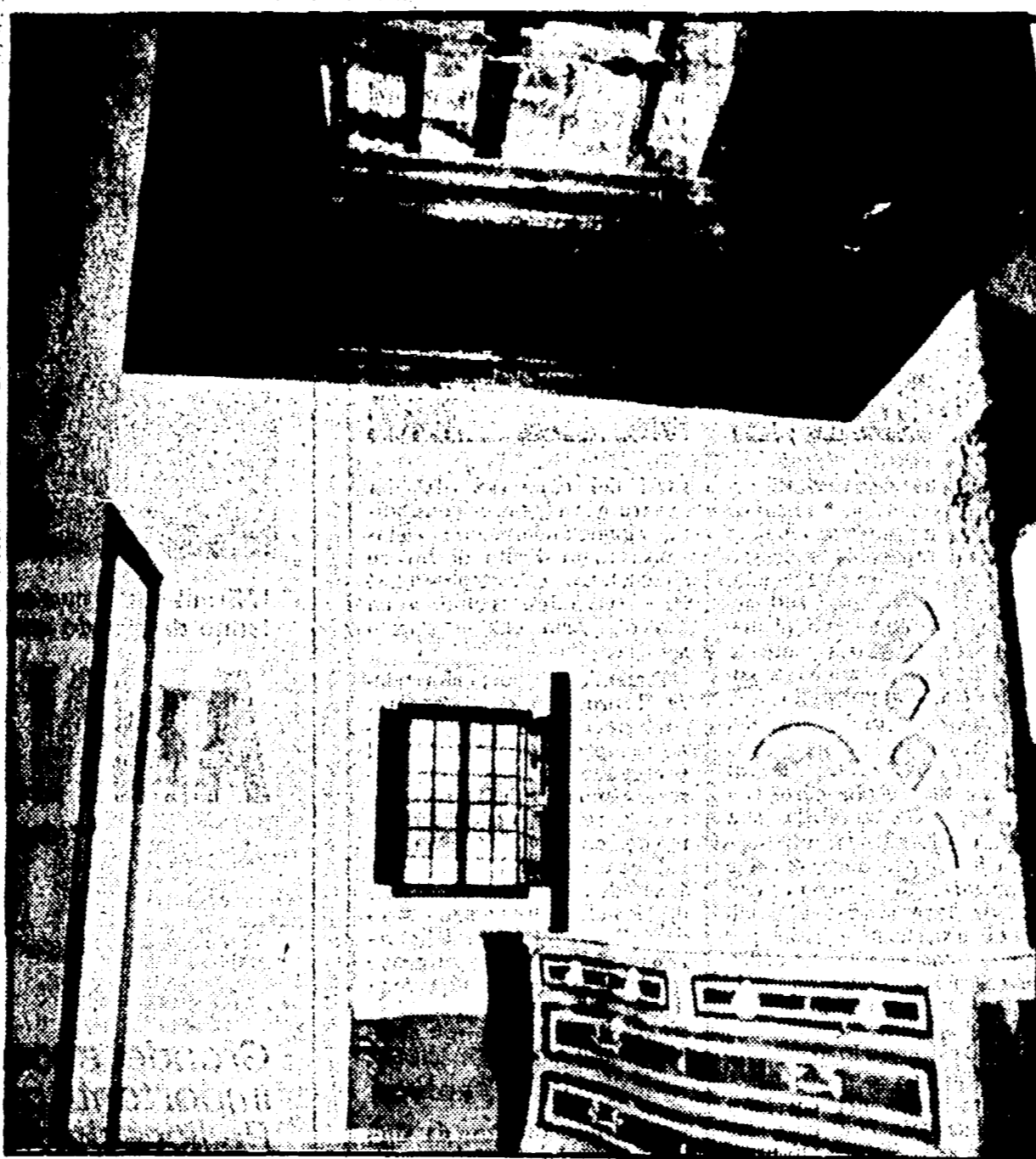
In alto il lucernale infranto, dal quale sono penetrati i ladri

I ladri che ieri notte hanno asportato dalle sale del museo Stibbert quindici quadri ed alcune centinaia di oggetti... La notte del furto è stata una notte di incubo per il museo Stibbert. I ladri, come riportiamo in altre pagine del giornale, hanno potuto svagare indisturbati lo Stibbert perché il museo non disponeva di alcun sistema di sicurezza...»