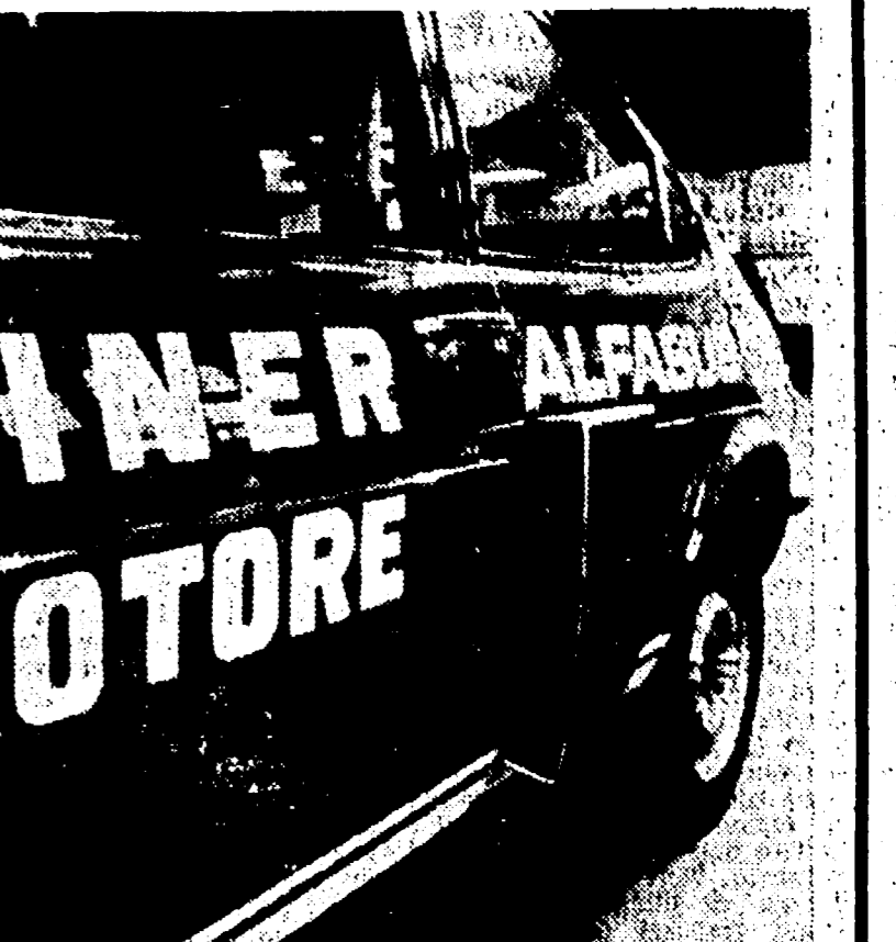
La Alfasud TI bimotore. Nel particolare si nota una delle prese d'aria laterali per il raffreddamento del motore posteriore.

Consente accelerazioni brucianti e una velocità massima intorno ai 215 km orari