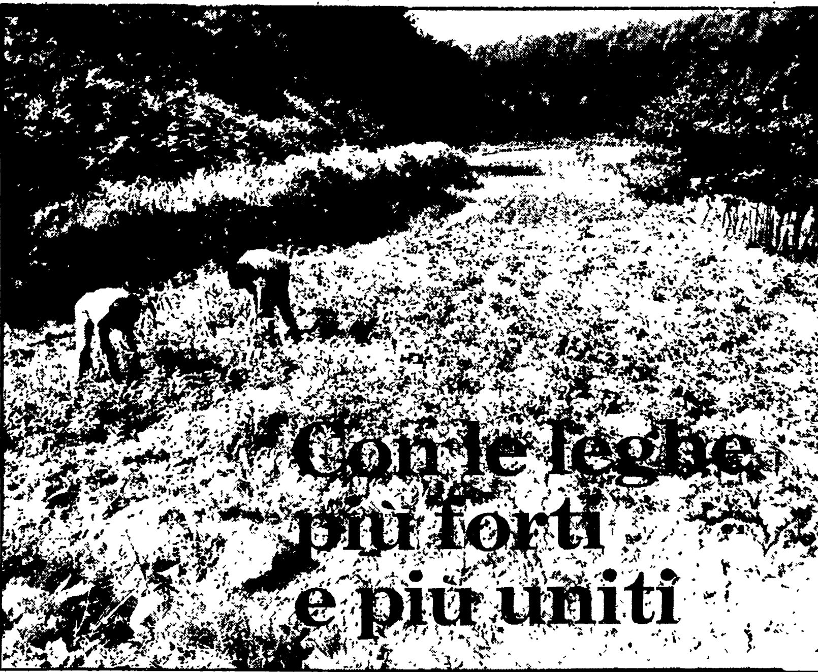
Con le leggi più forti e più uniti

Già si sta lavorando per preparare l'incontro del 4 dicembre con Bruno Trentin - La ricerca tenace di nuove e ampie alleanze - L'esperienza della cooperativa «La Stalletta» - Il 16 giornata di lotta e discussione a Civanova