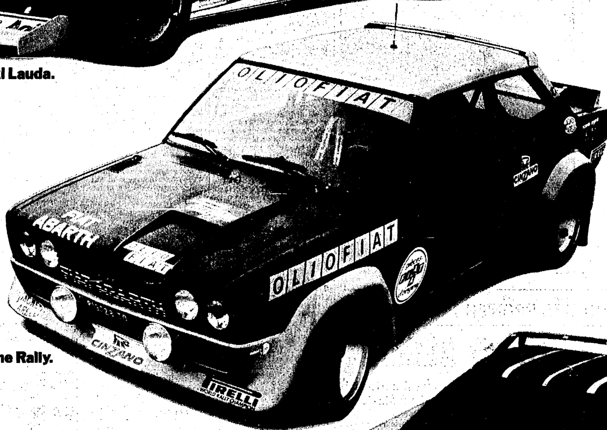
Fiat 131 Abarth Rally Campione Mondiale Marche Rally.