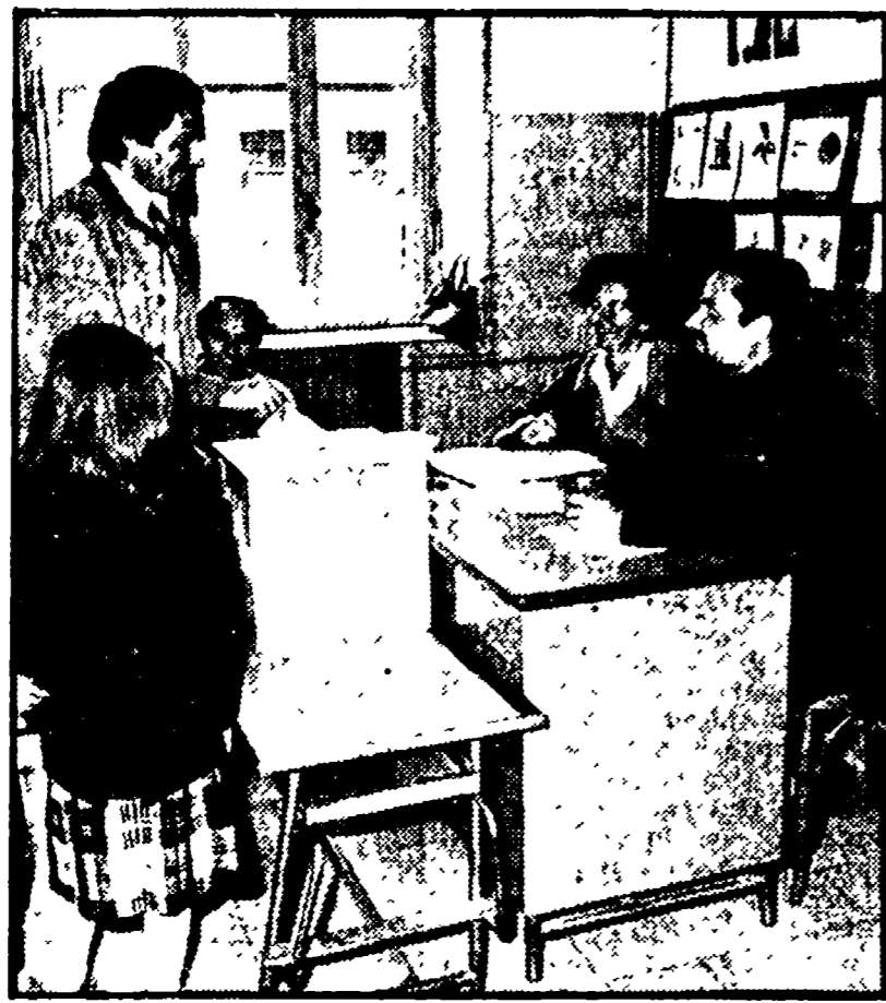
ROMA - Volazioni in una scuola della capitale