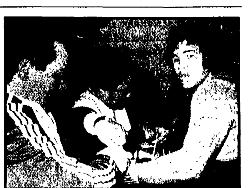
EVANGELISTA-COPMAN A BRUXELLES

Erano tutti preoccupati per la mancanza di neve. Livigno aveva già dovuto rinunciare all'ormai classica apertura e si temeva che anche San Siro, una stazione invernale pienamente, dovesse rinunciare al doppio slalom delle «World Series».