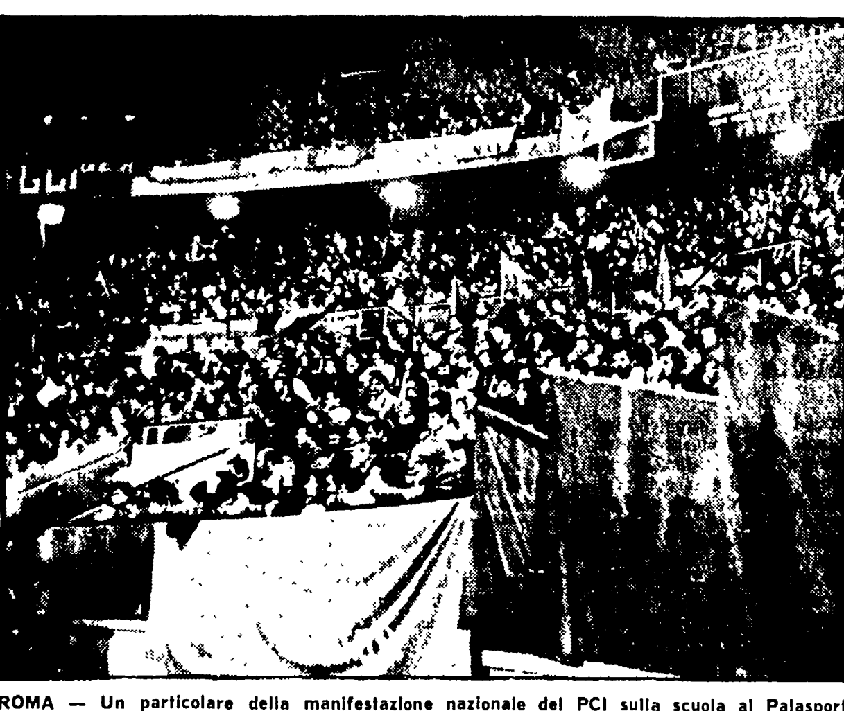
ROMA - Un particolare della manifestazione nazionale del PCI sulla scuola al Palasport