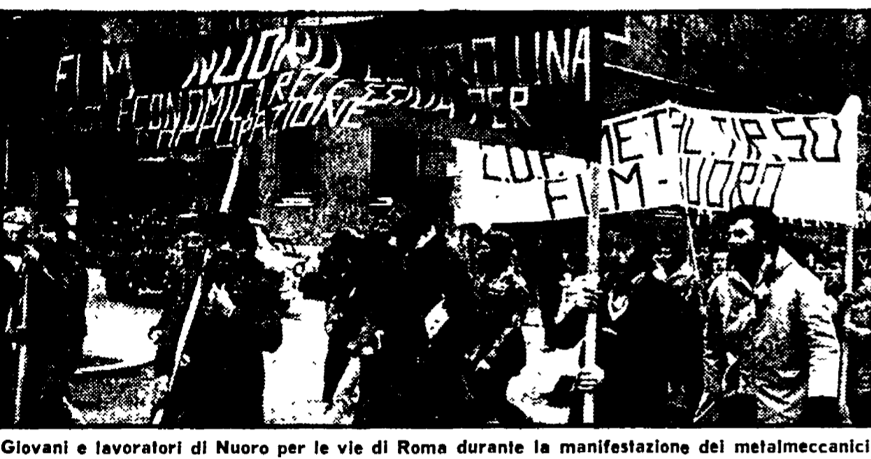
Giovani e lavoratori di Nuoro per le vie di Roma durante la manifestazione dei metalmeccanici

Aggredito dai fascisti il segretario della Fgci di Irto