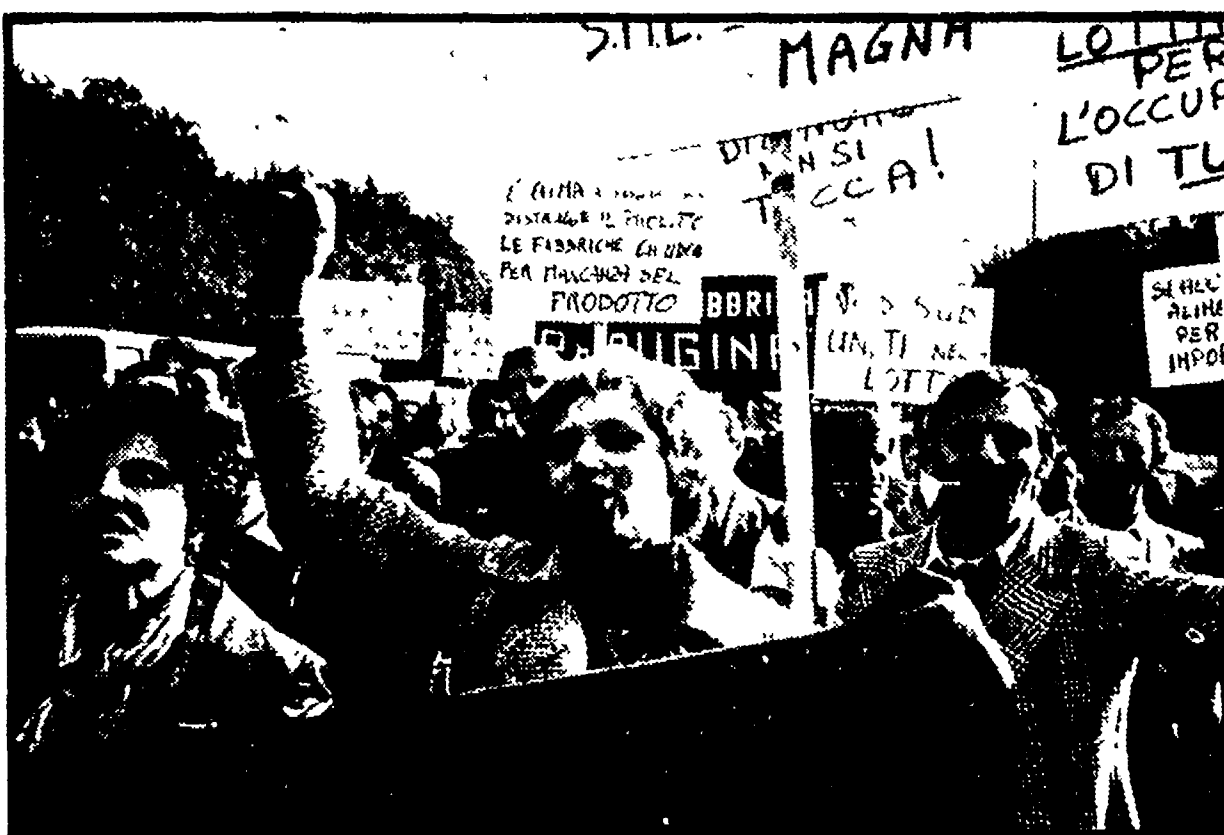
Dalla nostra redazione

Non cessa però la mobilitazione - Dopo il deludente incontro con il governo programmate nuove azioni di lotta