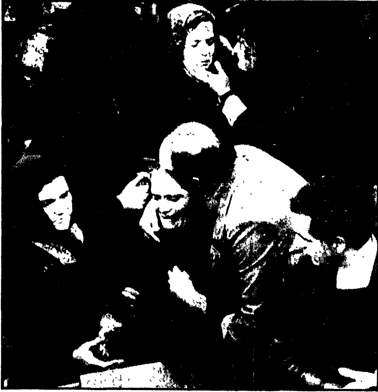
BRINDISI — Il dolore dei familiari durante i funerali dei tre operai

Migliaia e migliaia di persone provenienti da tutte le fabbriche e da ogni quartiere hanno seguito i feretri dei tre operai morti « Si deve tornare alla normale lavorazione appena possibile » - Sequestrato dal magistrato il registro dei lavori di manutenzione