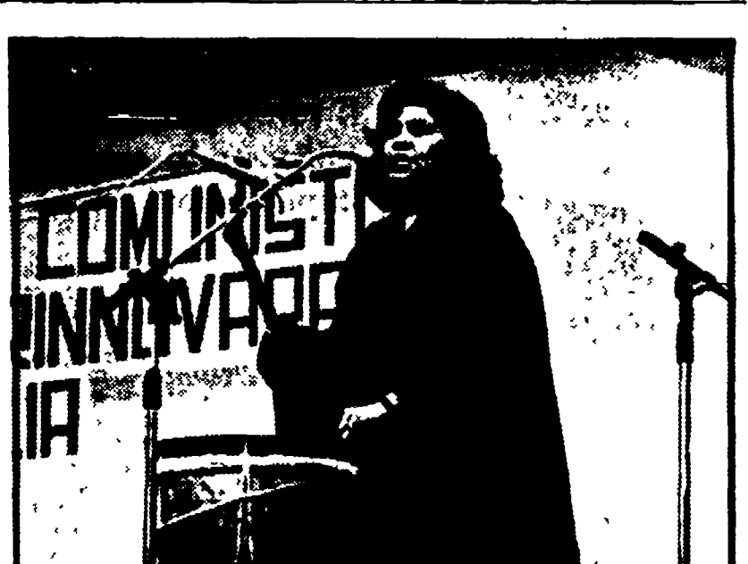
SPETTACOLO PER IL CILE FOLIGNO

Parallelemente l'esecutivo avvierà una verifica con i sindacati - Si parla soltanto del nuovo impianto di precipuati - Giudizio negativo della giunta regionale - « Gli impegni erano ben altri per lo stabilimento di S. Sisto »