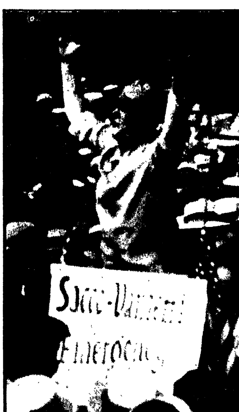
Una manifestazione popolare negli Stati Uniti a sostegno di Sacco e Vanzetti ai tempi dell'ingenuo processo