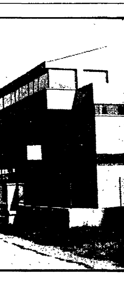
NUOVA SCUOLA A PISTOIA

L'iniziativa promossa dal consorzio degli artigiani - La costruzione avverrà a prezzi bloccati - Il ruolo svolto dal Comune