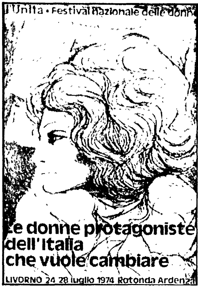
Le donne protagoniste dell'Italia che vuole cambiare