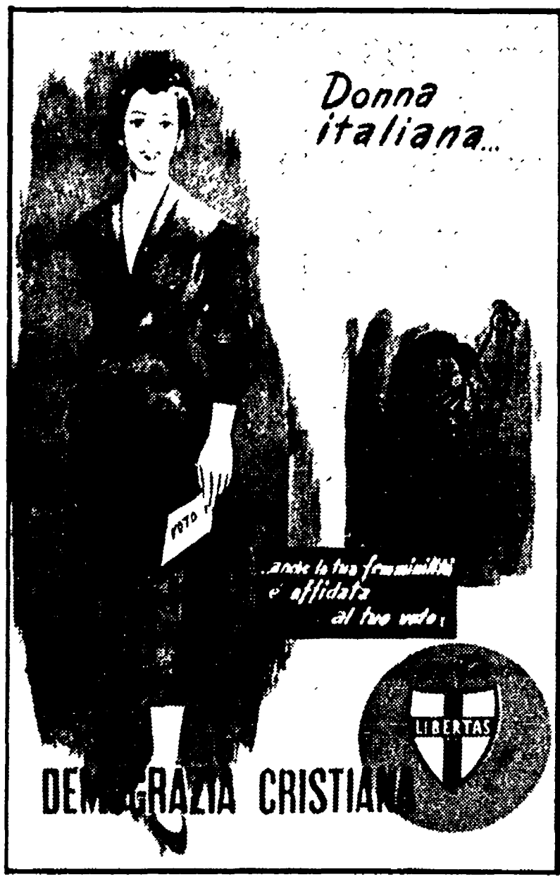
Donna italiana... DEMAGGIA CRISTIANA