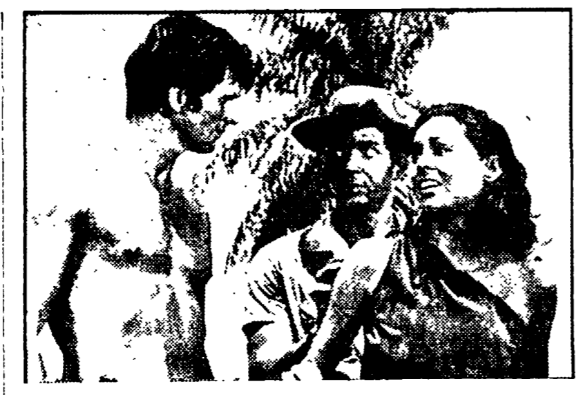
L'attore Ron Ely, uno dei tanti Tarzan cinematografici