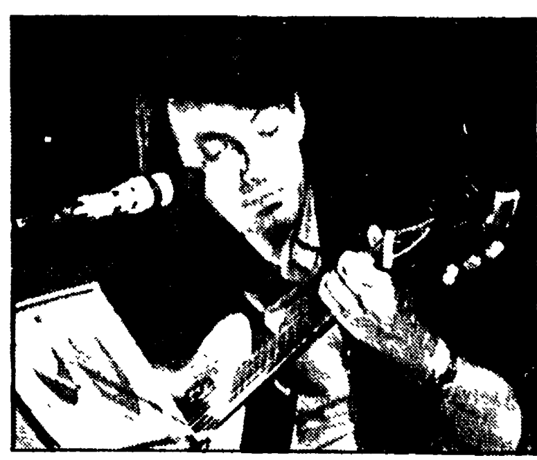
Fabrizio De André

«Faccio l'alleatore in Sardegna. Al momento vivo in un appartamento in affitto. Ho un allevamento di vacche allo stato brado. Il mercio con dei tori francesi...»