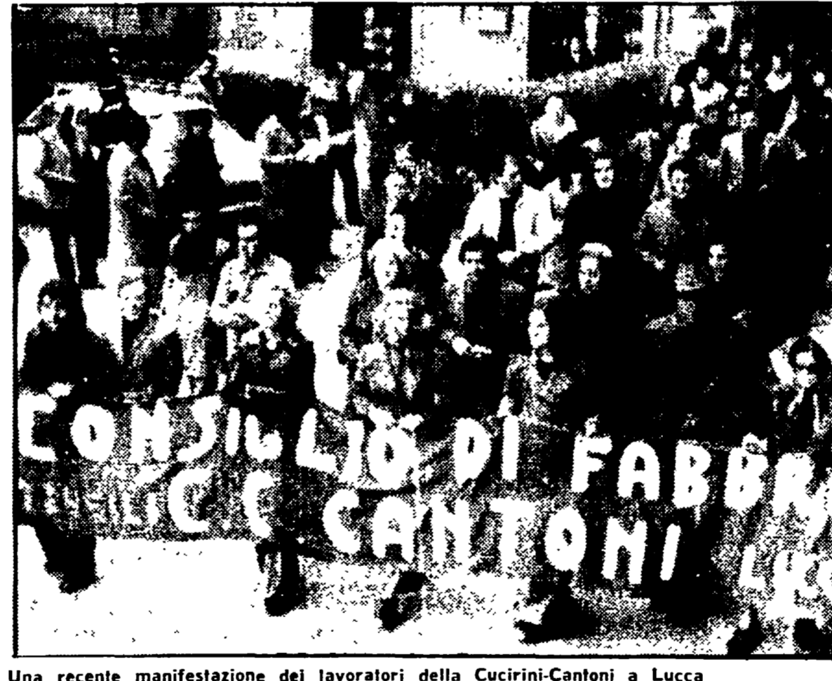
Una recente manifestazione dei lavoratori della Cucirini-Cantoni a Lucca

provincia, abbiamo di fronte?», si domanda il rappresentante di fabbrica. Ed elenca un rosario di cose che non vanno. Soprattutto l'atteggiamento complessivo dei dirigenti del «gigante dei Cucirini» che, dopo essersi dimostrati disponibili ad incontri e ad abboccamenti chiarificatori nei tempi passati, ora hanno scelto la strada della chiusura, tentando di mettere tutti, lavoratori, sindacati, forze politiche ed enti locali di fronte al fatto compiuto.