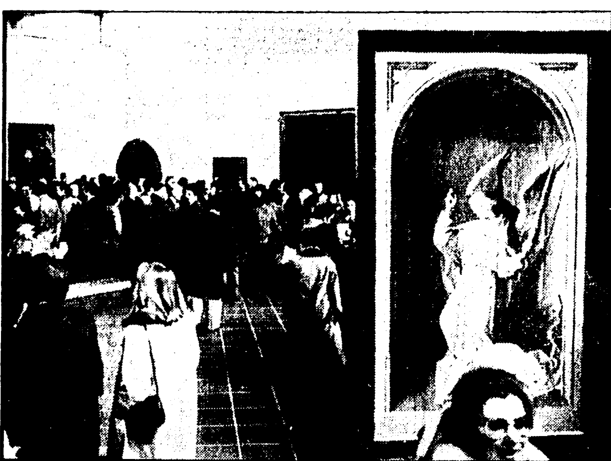
La sala del Botticelli agli Uffizi