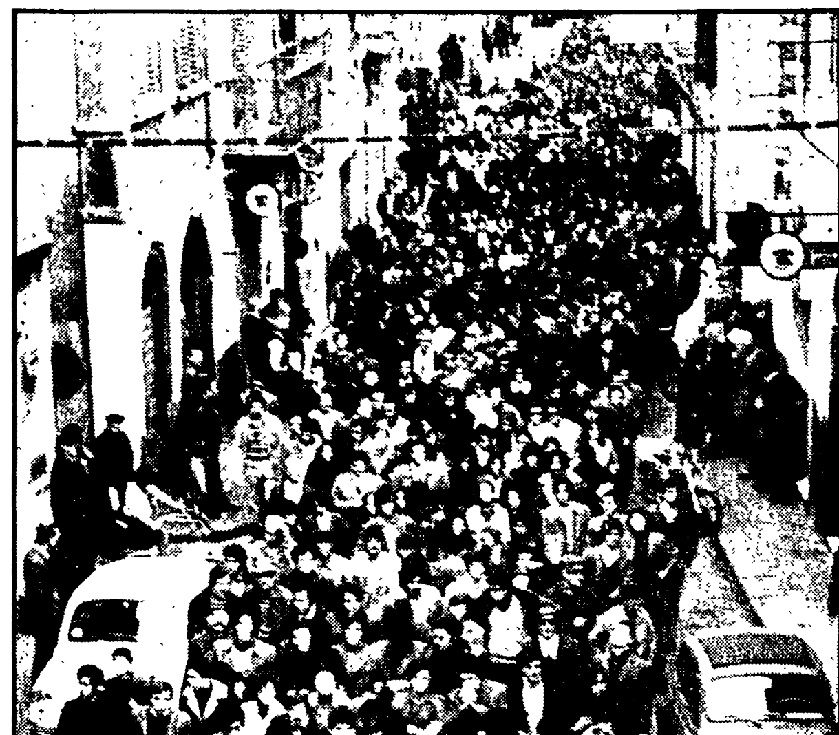
I lavoratori di Piombino sfilano in corteo

Sarà questa l'occasione non solo per chiarire l'atteggiamento della direzione verso le richieste sindacali, ma per verificare le reali intenzioni padronali sul futuro dello stabilimento piombinese.