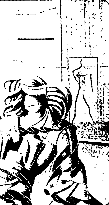
Mostra di Mantovani a L'Aquila

Dalla nostra redazione BARI - Notevole importanza strategica assume la fornitura di metano algerino per lo sviluppo economico e sociale della Puglia e del Mezzogiorno. Lo ha sottolineato la federazione regionale CGIL-CISL-UIL che in un incontro con le strutture categoriali del settore energia e con alcuni consigli di fabbrica direttamente interessati, ha esaminato il problema delle fonti energetiche ed in tale contesto i problemi inerenti l'utilizzazione del metano proveniente dall'Algeria.