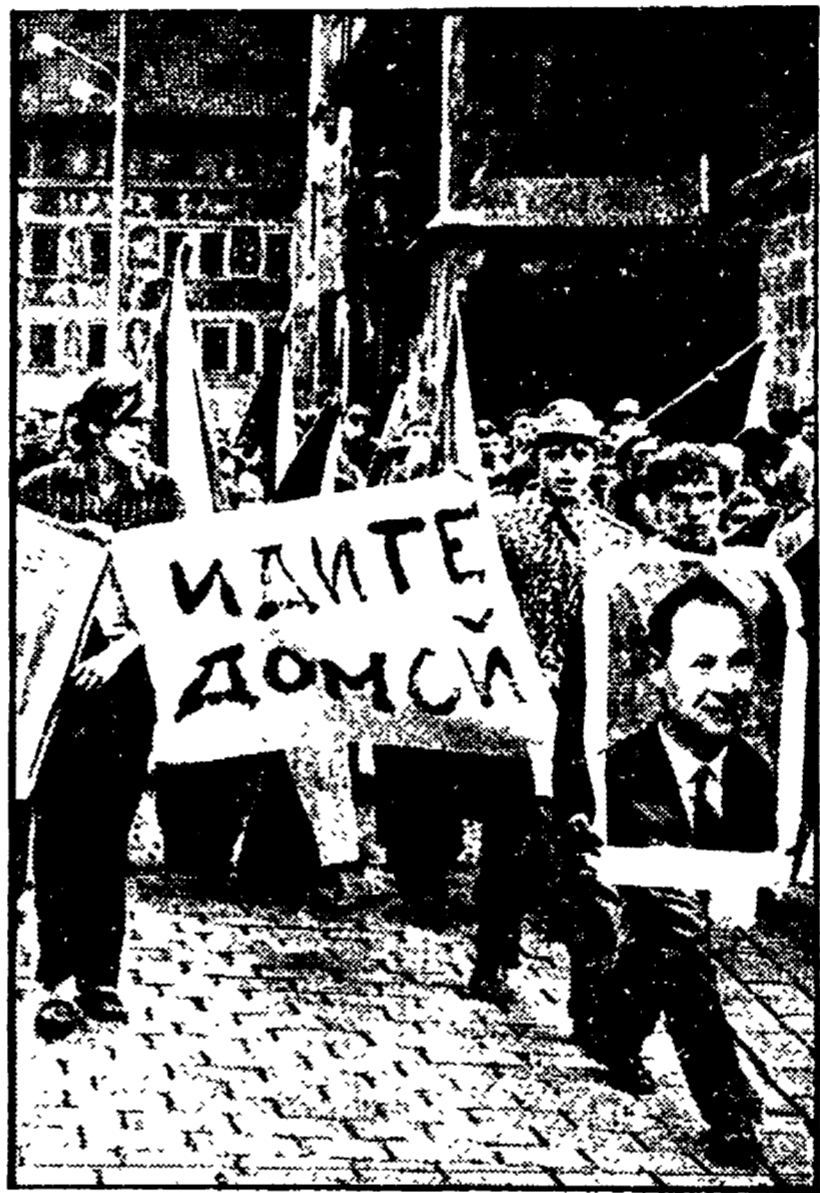
Due immagini di Praga negli ultimi giorni di agosto del 1968