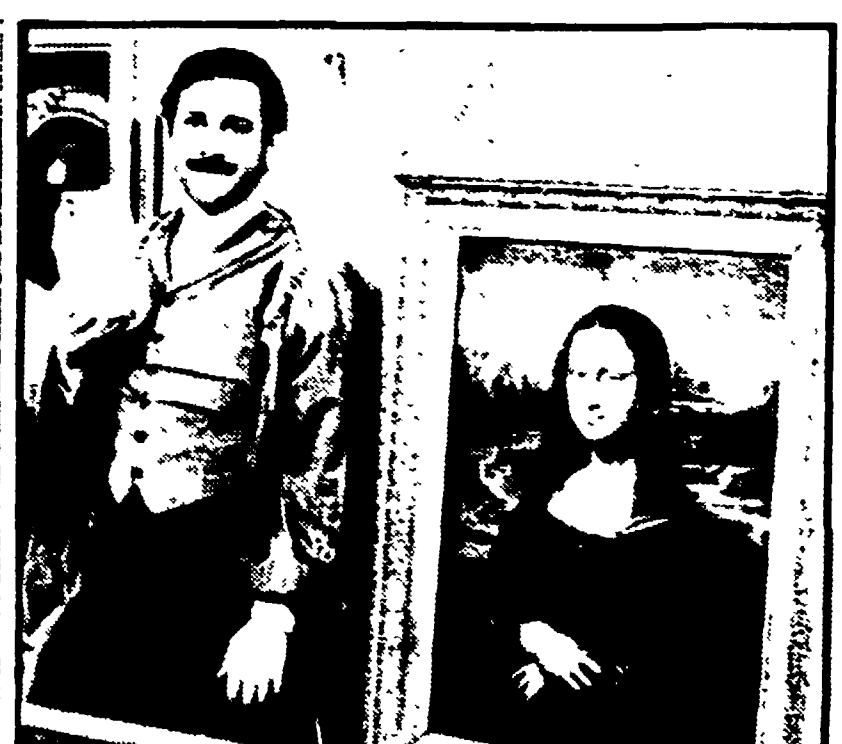
Enzo Cerusico in una scena di «Il furto della Gioconda»