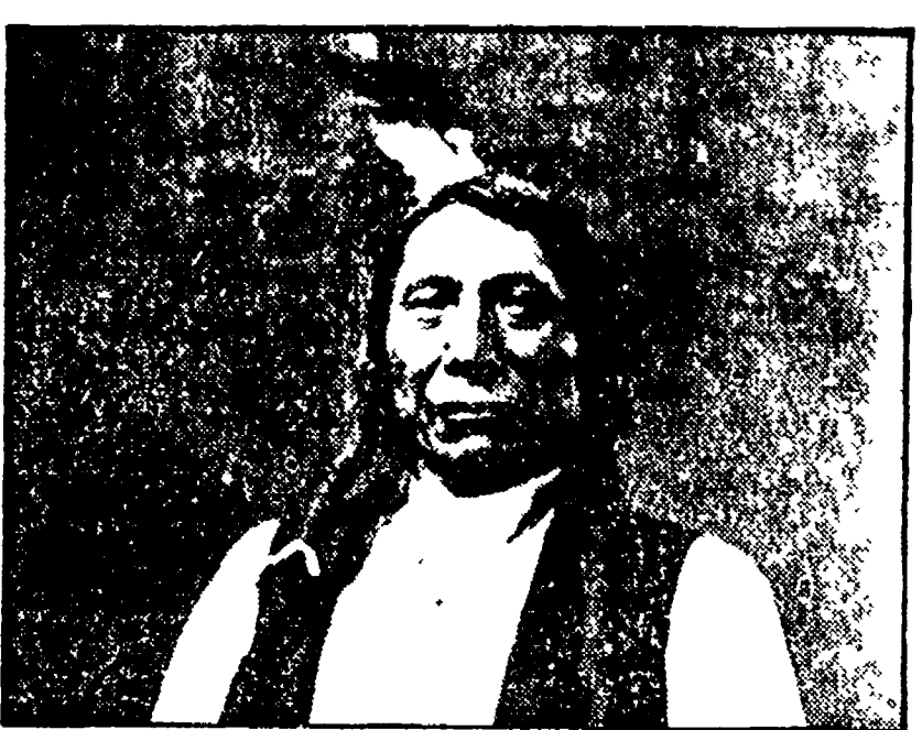
Il capo indiano «Nube rossa»