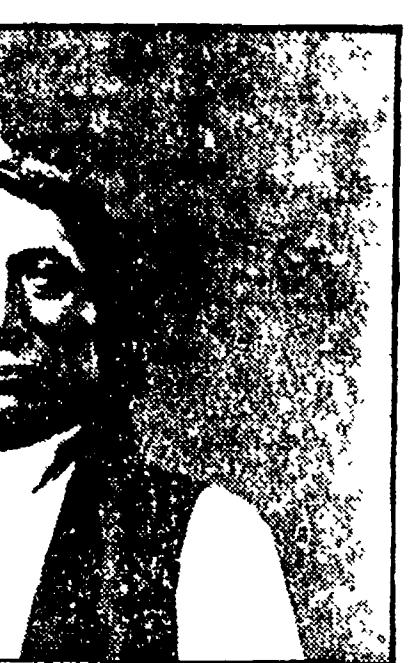
Il capo indiano «Nube rossa»