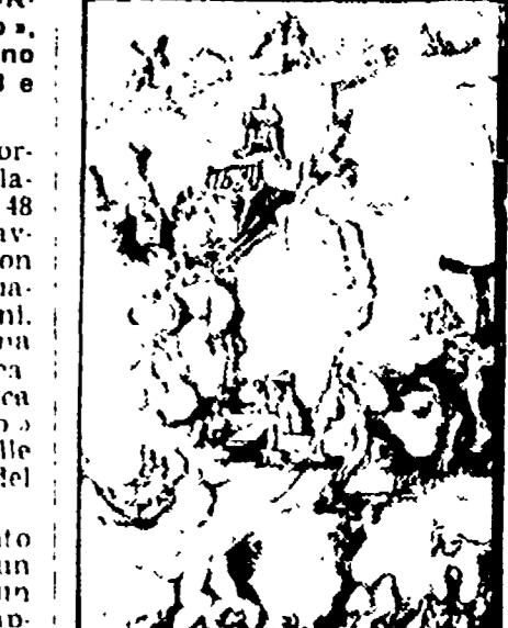
Raffaele Leomporri: «Studio per la spiaggia», 1963