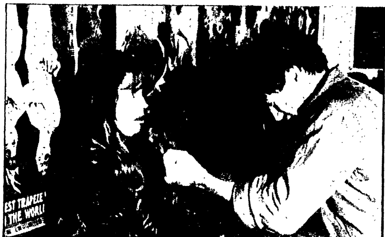
Liv Ullmann e David Carradine in una scena del film di Bergman