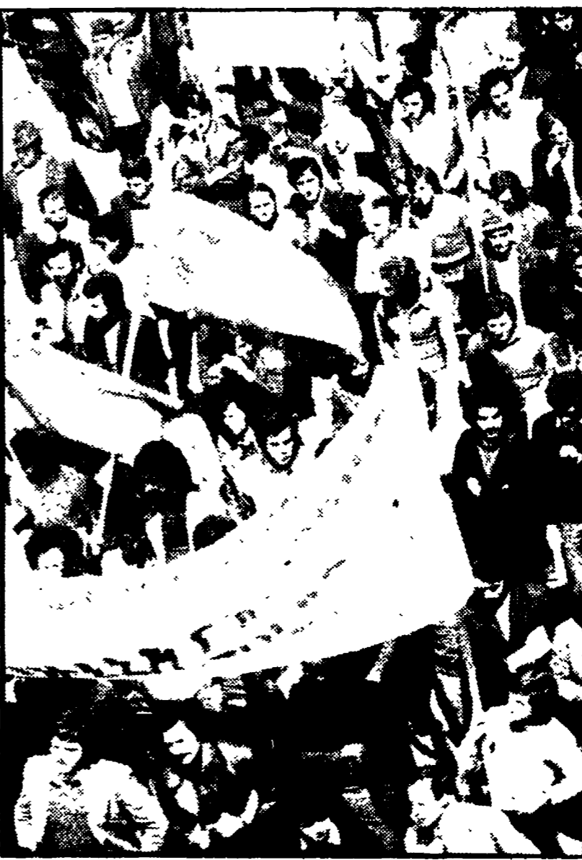
ASSEMBLEA APERTA ALLA COGI DAU

La manifestazione è stata una sfida alle istituzioni e ai partiti democratici. Il clima teso a Potenza dopo gli incidenti ieri mattina all'entrata delle scuole «civette» e squadre di polizia - Assemblee volanti - Il bilancio dei disordini per l'arresto a Roma dei 6 autonomi - L'atteggiamento della grande stampa - A colloquio con gli studenti