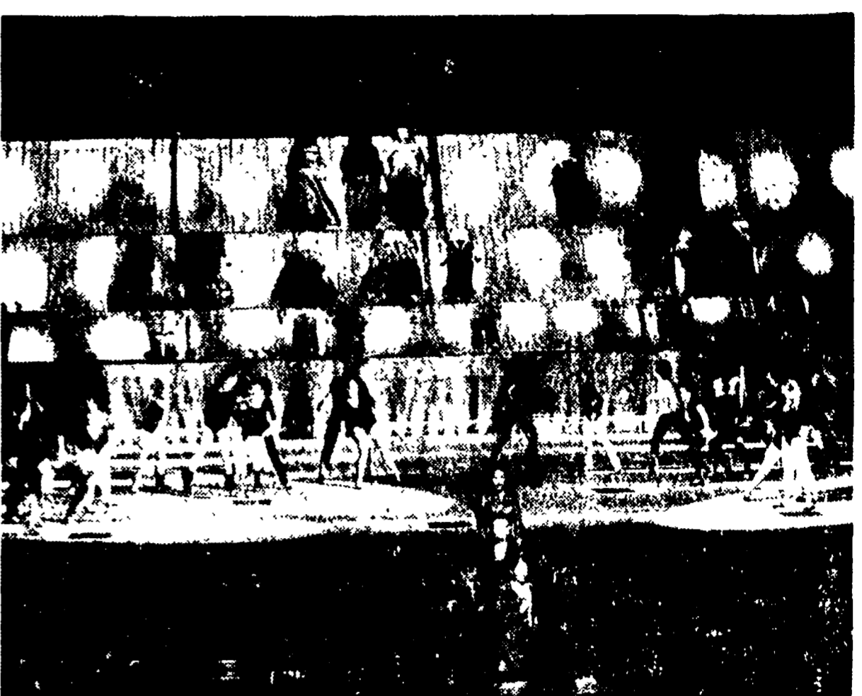
NELLA FOTO: una scena del «Gran sole carico d'amore».

Particolarità e pregi dell'allestimento scenico