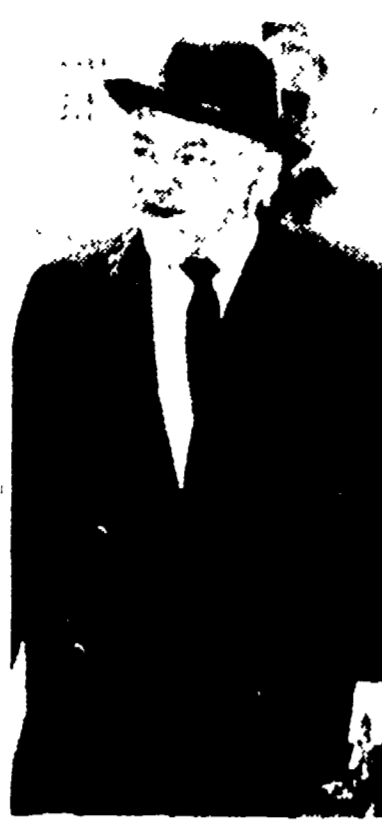
Edward G. Robinson