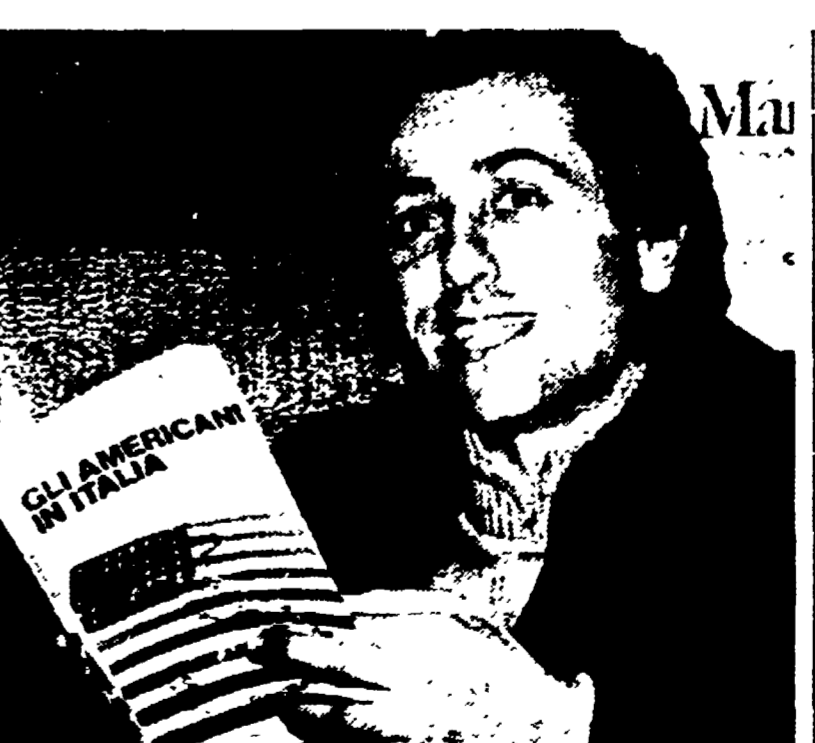
A colloquio con il regista, presente a Ferrara alla proiezione del suo film

FERRARA - «Facciamo appena in tempo a presentarci quando è già chiaro che per un po' vuole essere lui, il regista di Forza Italia!», a fare il primo passo è stato il generale la sinistra ha avuto espressioni contraddittorie, anche se questa è la critica che gli interessa. L'importante è - egli aggiunge - e che il mio film lo vedano tutti, anche i democristiani.