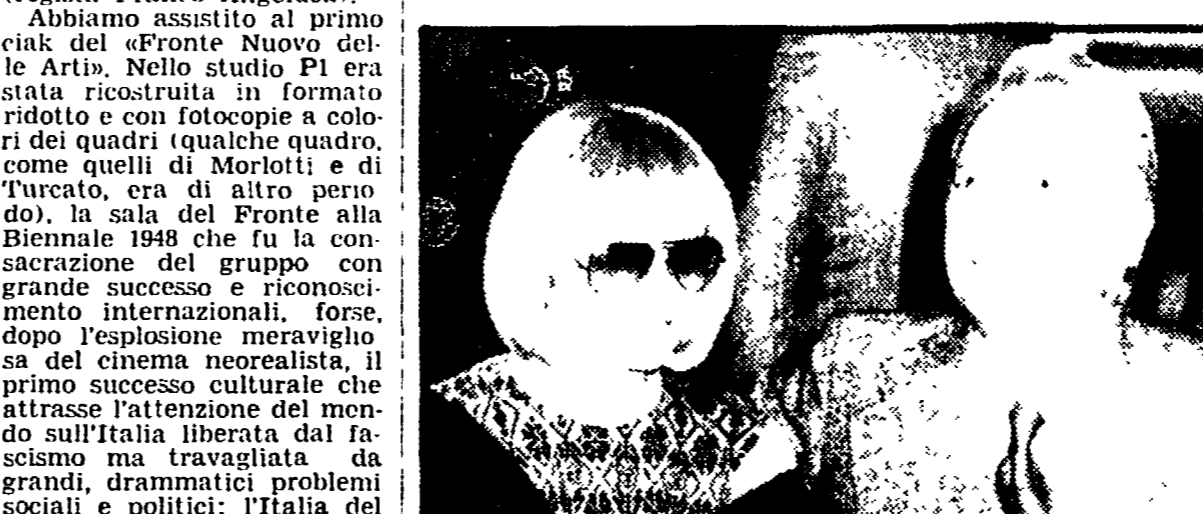
Raffaella Carrà e Alighiero Noschese negli studi televisivi