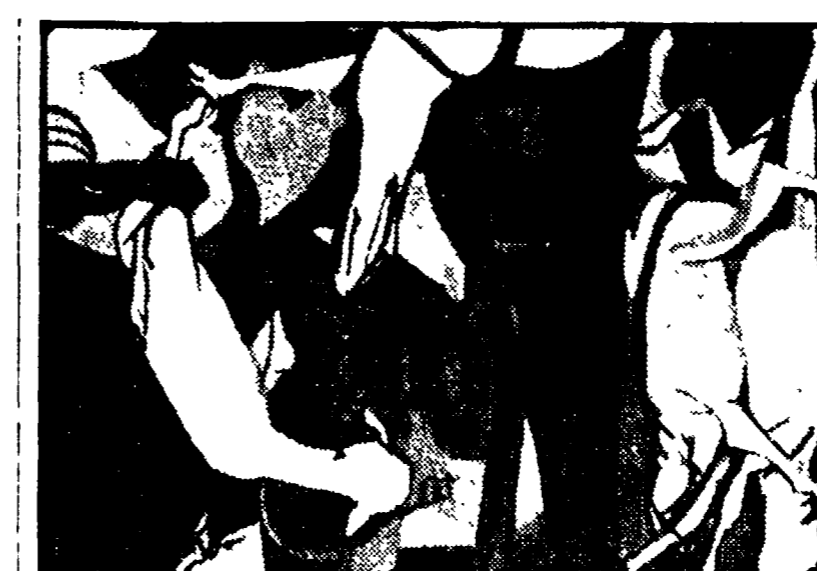
Renato Guttuso «Massacro», 1948