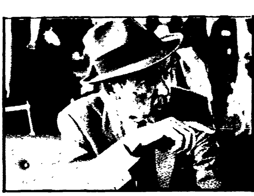
James Stewart nel film «Dopo l'uomo ombra»