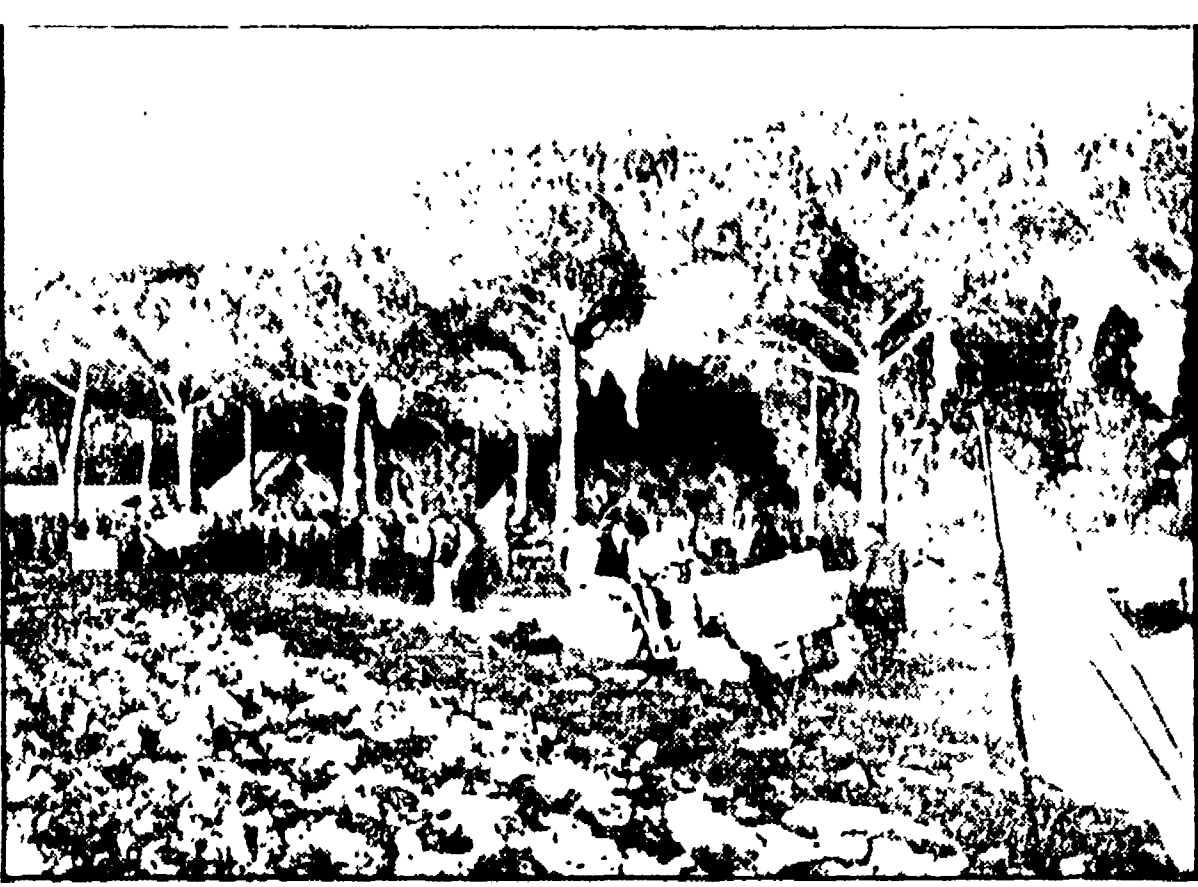
Una manifestazione per le terre incolte a Collina

PONTEREDERA - In occasione del congresso della Lega delle Cooperative e Mutue...»