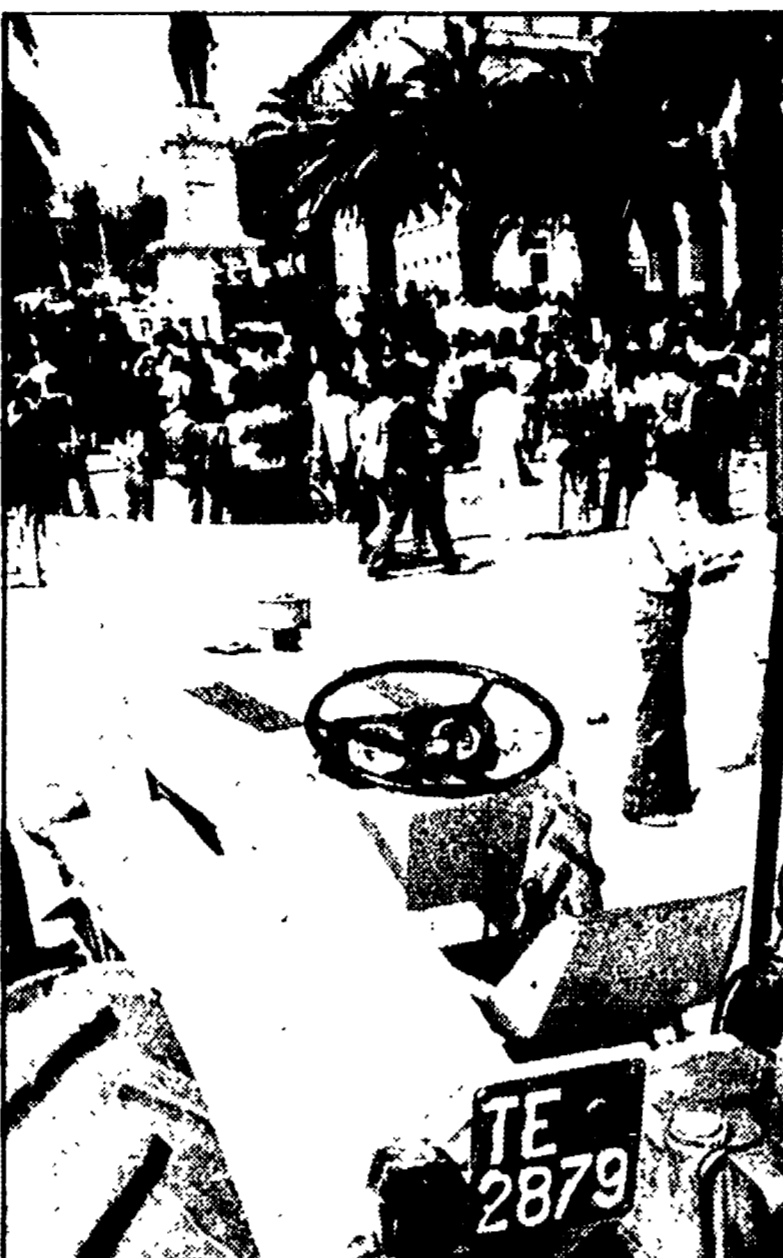
Un'occupazione di terre organizzata dai giovani disoccupati abruzzesi

SANTA CATERINA — La cooperativa delle ricamatrici siciliane «Rosa rossa» di Santa Caterina si è presentata ieri ufficialmente alla popolazione con una conferenza nell'aula consiliare del Comune. Anche se la regolarizzazione della cooperativa era già avvenuta da tempo (sono già state ultimate le prime commissioni ricevute da importanti ditte nazionali che operano nel settore della biancheria per la casa; commissioni per svariati milioni che hanno assicurato un lavoro a tutti gli interessati), le ricamatrici di Santa Caterina hanno voluto avere un momento ufficiale di incontro con la popolazione di questo grosso comune dell'interno della Sicilia, per sottolineare la continuità di un rapporto di solidarietà e di lotta che ha contraddistinto in tutti questi anni la vicenda di queste lavoratrici.