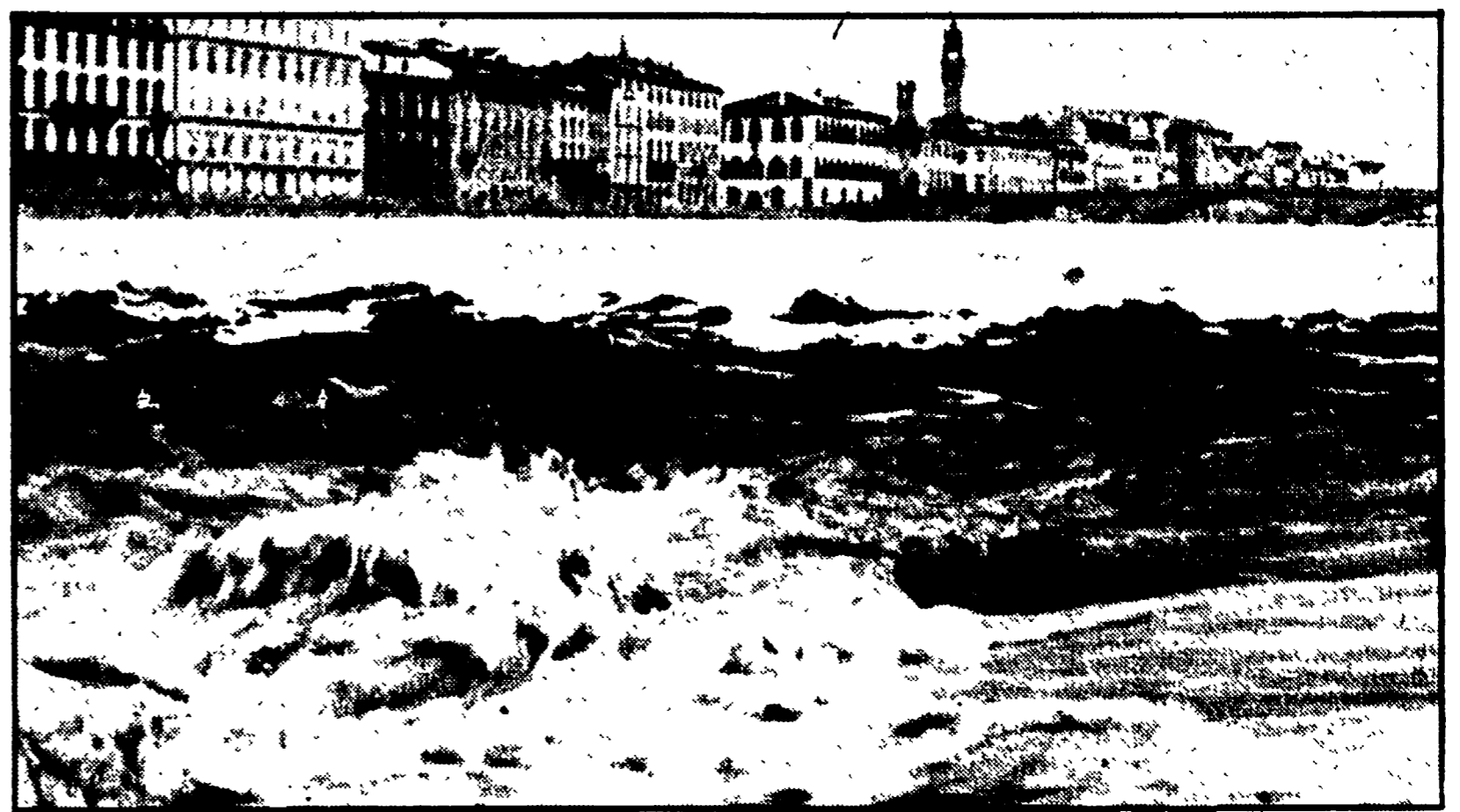
Due metri al ponte Vecchio

zione dell'accordo del settembre 1976 per la ristrutturazione del settore mercurifero e la sua riconversione industriale in val di Paglia.