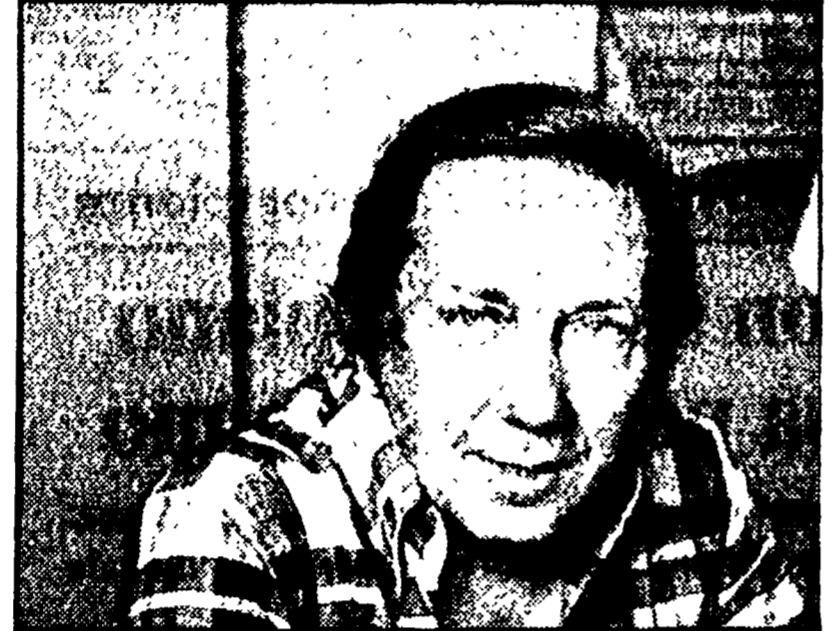
Mike Bongiorno presenta « Scommettiamo? » (Rete 1, ore 20,40)