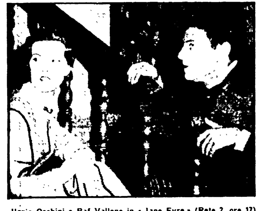
Maria Occhini e Raf Vallone in « Jane Eyre » (Rete 2, ore 17)