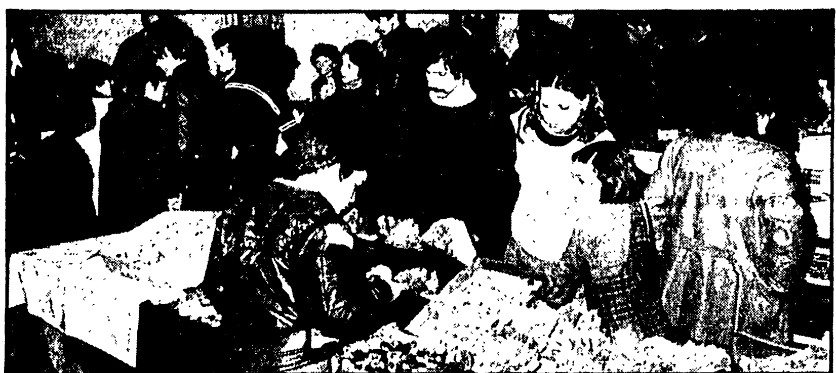
Una sala della mostra dei minerali di Rosignano, affollata dai visitatori

Numerosi i pezzi esposti provenienti da tutte le regioni d'Italia e dall'estero — Un originale incontro tra esperti, dilettanti e scolari — Occasione di studio e scambio di informazioni