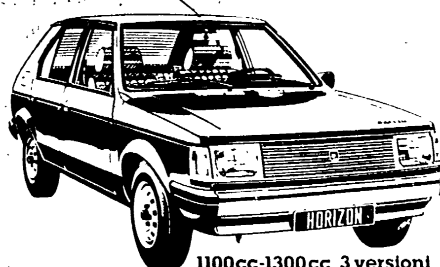
1100cc-1300cc 3 versioni