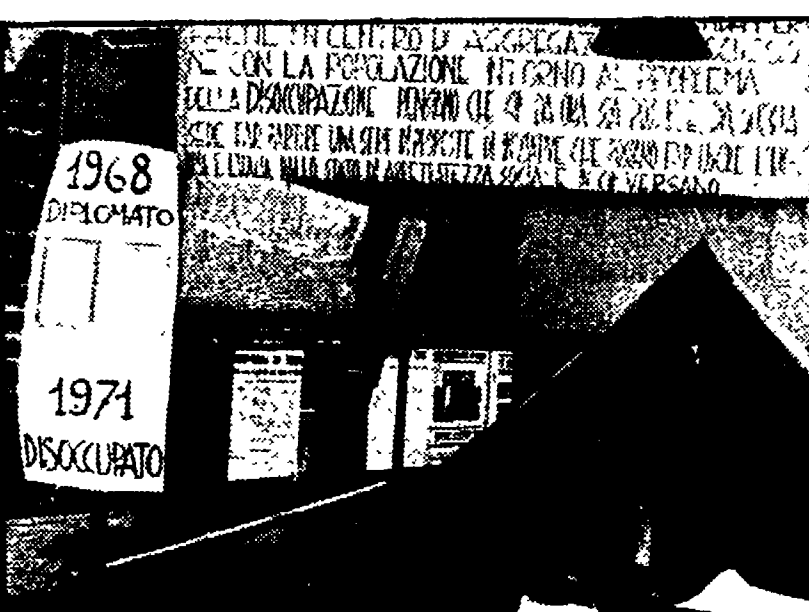
Una tenda in piazza della lega dei giovani di Terni all'epoca dell'iscrizione alle liste speciali del preavviamento