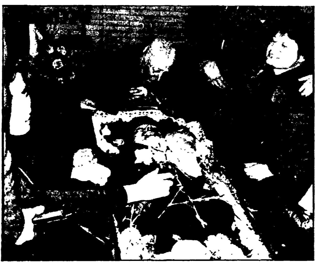
ROMA - Il dolore dei familiari degli agenti e dei carabinieri barbaramente assassinati