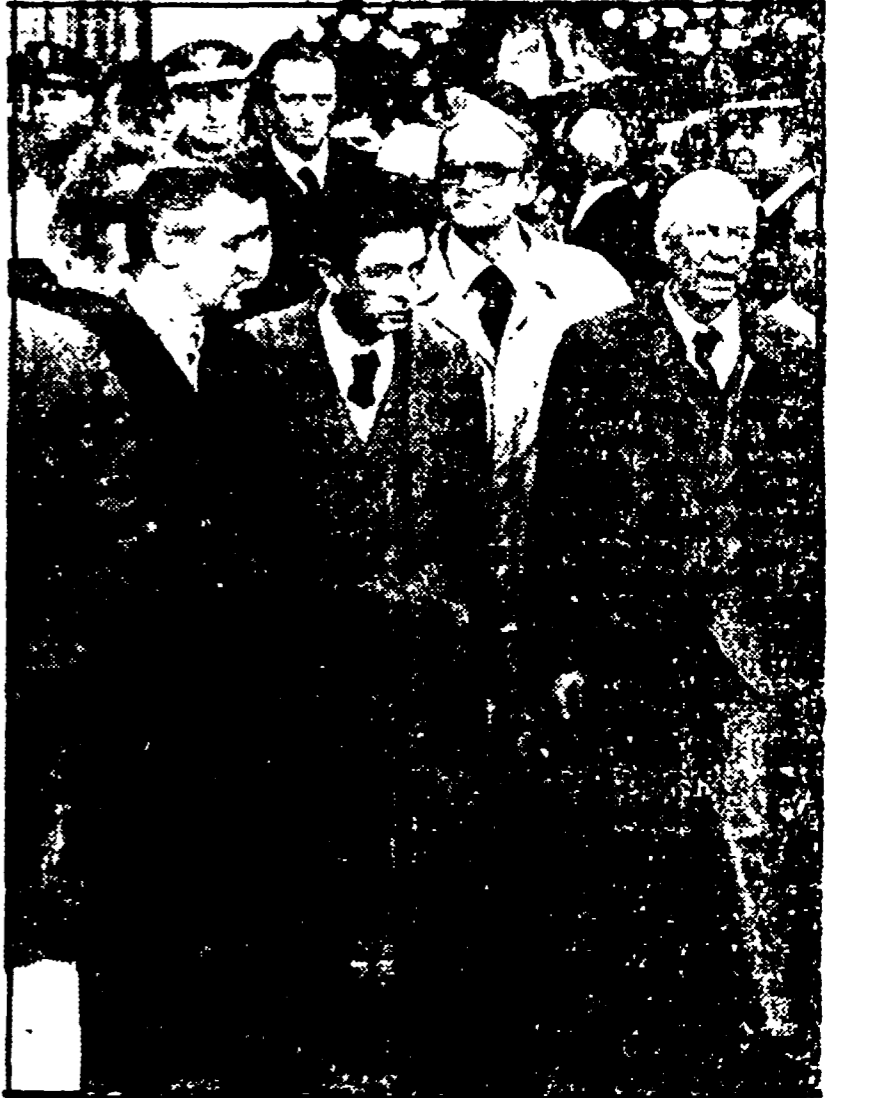
ROMA - I compagni Berlinguer, Pajella e Pecchioli ai funerali degli agenti e dei carabinieri massacrati dai terroristi

morti per la democrazia: «PCI libertà, DC libertà».