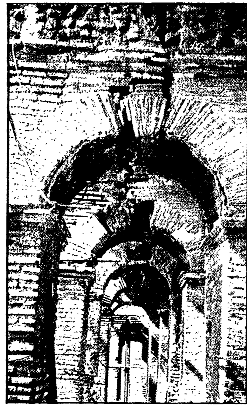
Monumenti in sfacelo