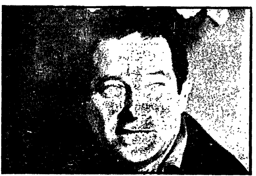
Gillo Pontecorvo partecipa a «16 e 35» (Rete 2, ore 22,30)