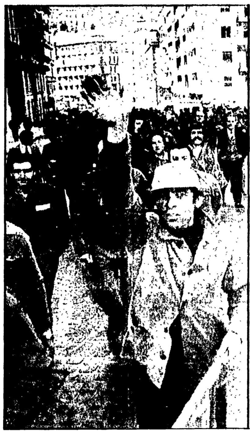
Un aspetto della manifestazione di ieri mattina all'Intersind

mente una delegazione del consiglio di fabbrica e della FLM si è incontrata con i dirigenti napoletani dell'Intersind. « Vediamo all'Intersind - hanno detto i rappresentanti sindacali - di svolgere un ruolo più attivo in questa vertenza... »