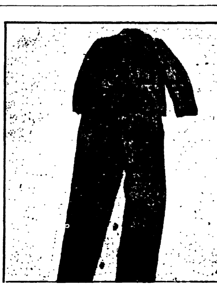
Vestito di feltro, multiplo, una delle opere esposte

Joseph Beuys è generalmente considerato uno dei sommi esponenti dell'arte contemporanea, tanto che le sue teorie sulla funzione dell'artista nella società sono rivoluzionarie. Il pubblico napoletano ebbe modo di conoscere l'artista tedesco, già nel 1971 alla galleria di Lucio Amelio, che per primo lo impostò in Italia, con una mostra intitolata appunto « La rivoluzione siamo noi ».