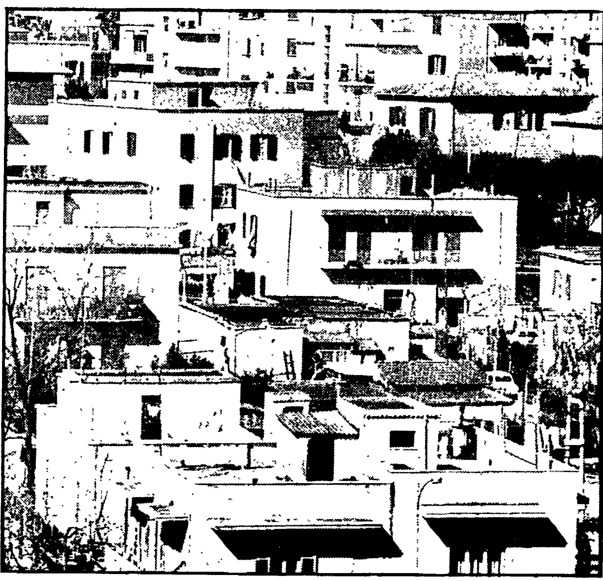
Palazzine proliferate in una borgata romana, Torre Maura