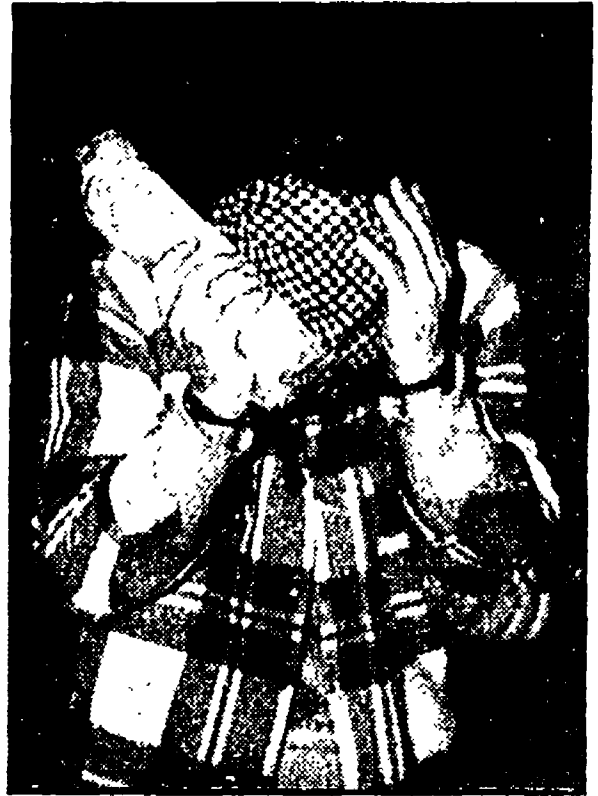
Claudio Secchi si nasconde il volto