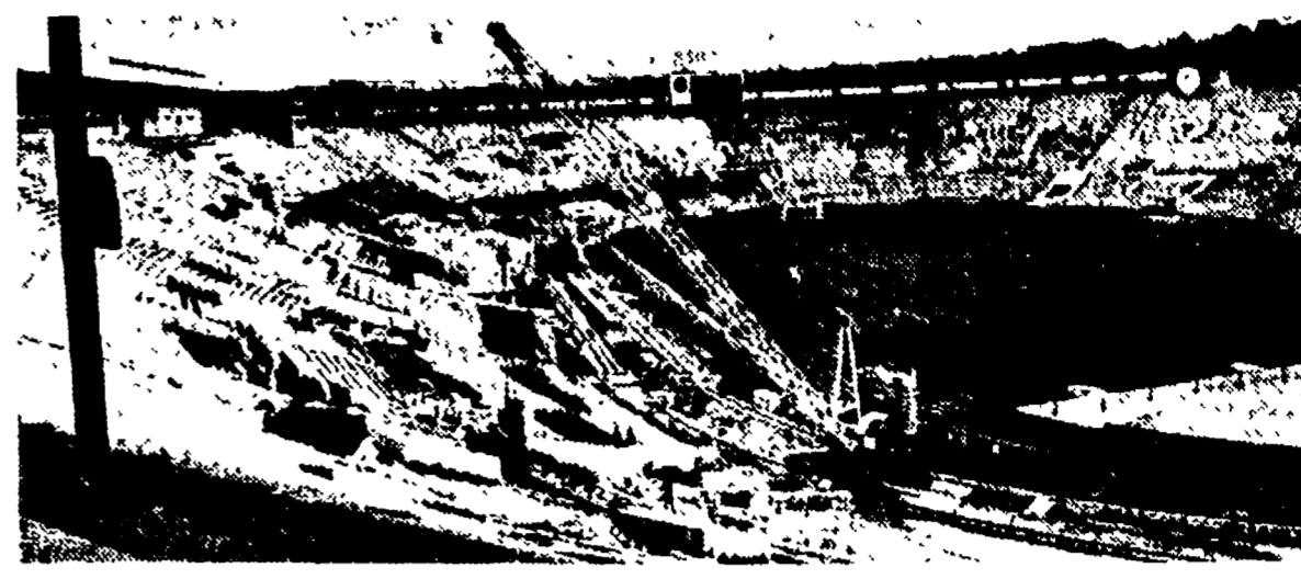
MOSCA - Lavori di restauro allo Stadio «Lenin».

Sei zone ospiteranno le gare - In costruzione uno stadio coperto ed una piscina per 10.000 spettatori