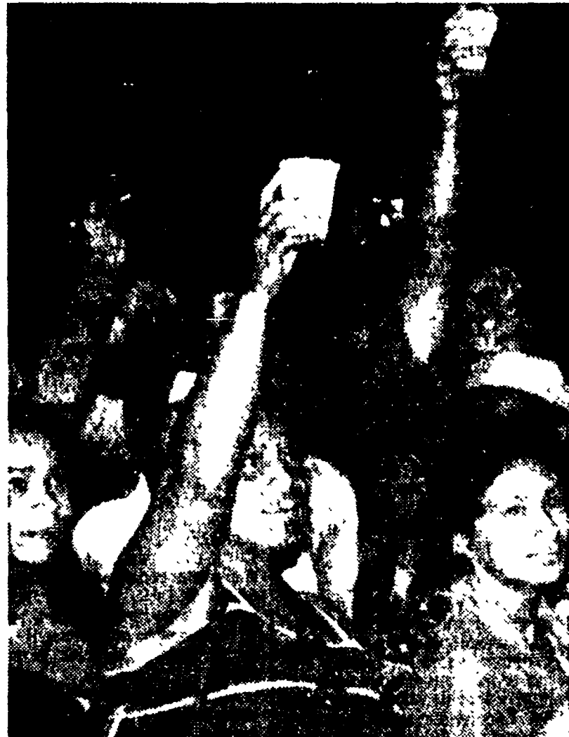
Festa grande a Panama per la ratifica dei trattati al Senato USA. Nella foto: alcuni dei panamensi scesi per le strade cantando, ballando e brindando al successo così lungamente atteso. In una recente conferenza stampa il presidente di Panama Torrijos aveva detto che le forze armate panamensi avevano deciso di intervenire entro 24 ore nel caso che il trattato non fosse stato ratificato dagli Stati Uniti.

democratiche. E alla insinuazione secondo cui il Pci avrebbe minacciato il caso nel caso fosse stato costretto all'opposizione, Napolitano ha risposto prima di tutto smentendo che il Pci abbia mai fatto ricorso a minacce di questo genere. «Le tensioni sociali e il disordine — ha poi osservato — sono una realtà. E in una situazione di questo genere l'Italia non può permettersi il lusso di avere l'opposizione né il Partito comunista né la Democrazia cristiana». L'articolo del «New York Times» rende conto poi di una conversazione avuta con il compagno Napolitano. E qui questo egli scrive può essere preso a modello della sorpresa che provoca in alcuni ambienti americani lo scoprire che i comunisti sono diversi da quello che ci si immagina che siano. Tutto, infatti, risente di vecchi schemi da cui non ci si sa evidentemente liberare e il risultato finisce con l'essere una semplificazione evidente e persino grossolana delle tesi espresse dal nostro compagno.