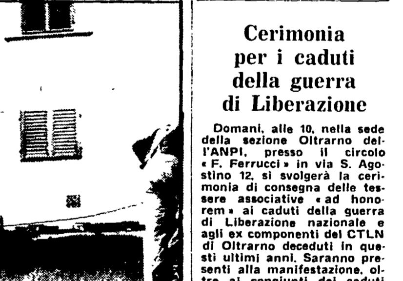
Il lucernario indicato dalla freccia dove si sono calati i trafugatori delle opere d'arte

Il furto delle «Tre Grazie» di Rubens e di altre nove tavole di pittori fiamminghi, trafugate dalla galleria Palatina di Palazzo Pitti ha riproposto ancora una volta drammaticamente il problema della difesa del nostro patrimonio artistico. Solo quando le opere scomparivano, con estrema facilità, come è avvenuto ieri mattina, sembra che ci si accorga da parte delle autorità che non esistono sistemi di allarme adeguati, che i servizi di vigilanza sono inadeguati.