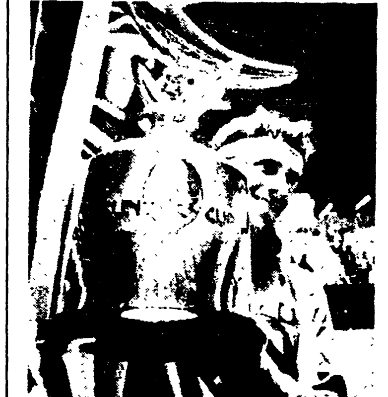
TOKIO — Un altro trionfo per il tennista Bjorn Borg. Ha vinto infatti la Suntory Cup a Tokio. Nella finalina ha liquidato, senza troppi complimenti, il bravissimo americano Jimmy Connors. Fin troppo eloquente il punteggio: 6-1, 6-2. NELLA FOTO: Borg mostra il prestigioso trofeo conquistato.