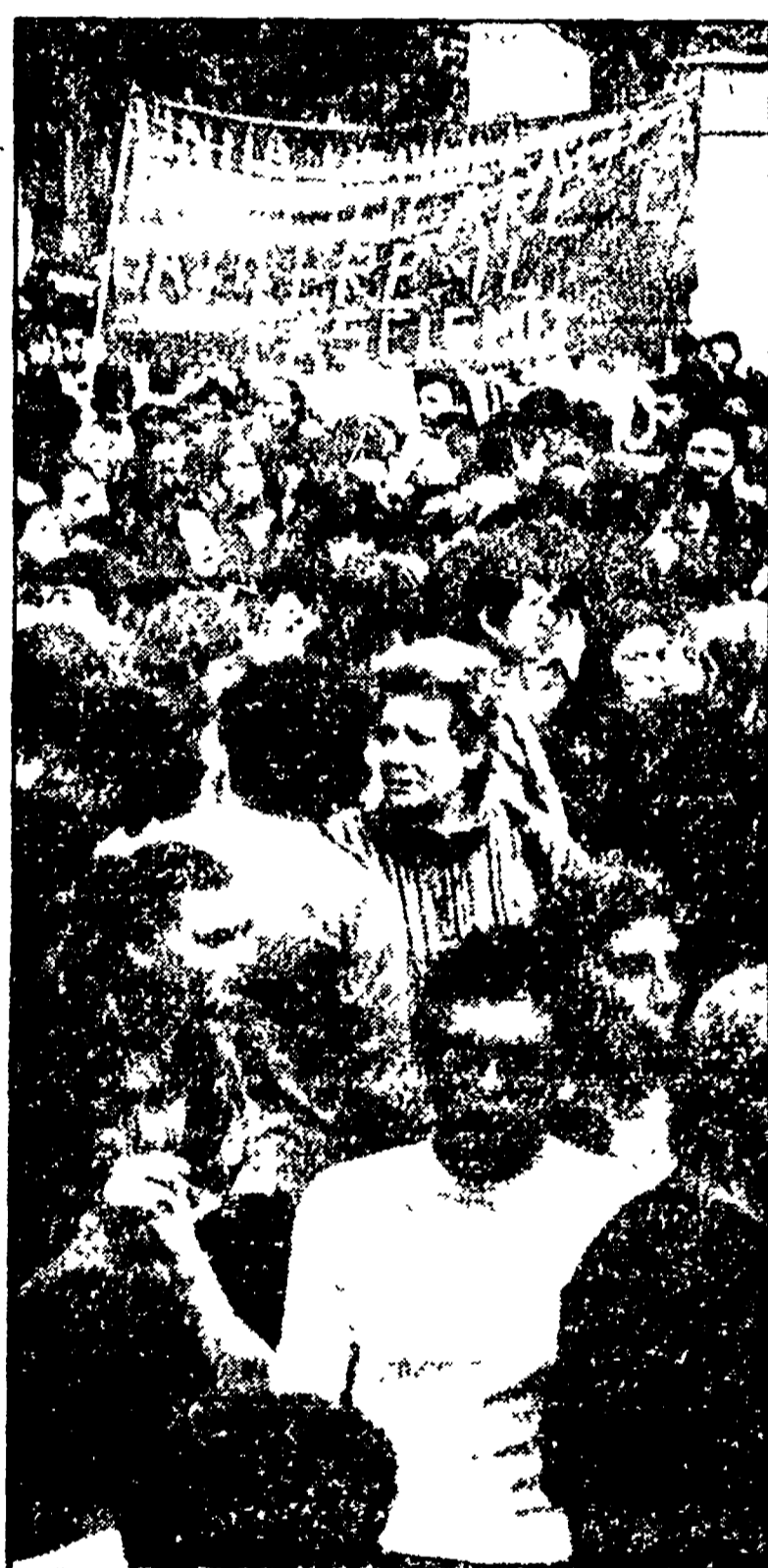
Una immagine della grande manifestazione antifascista tenutasi a Bari un anno fa e alla quale partecipò anche il presidente della DC, on. Moro, visibile nella foto sul palco insieme alle autorità cittadine

Un 25 Aprile che da giornata di celebrazione assume carattere di mobilitazione e di lotta al terrorismo in tutta la regione. Questo è testimoniato dall'attaccamento che anche le popolazioni molisane, come del resto del popolo meridionale, hanno verso le istituzioni democratiche.