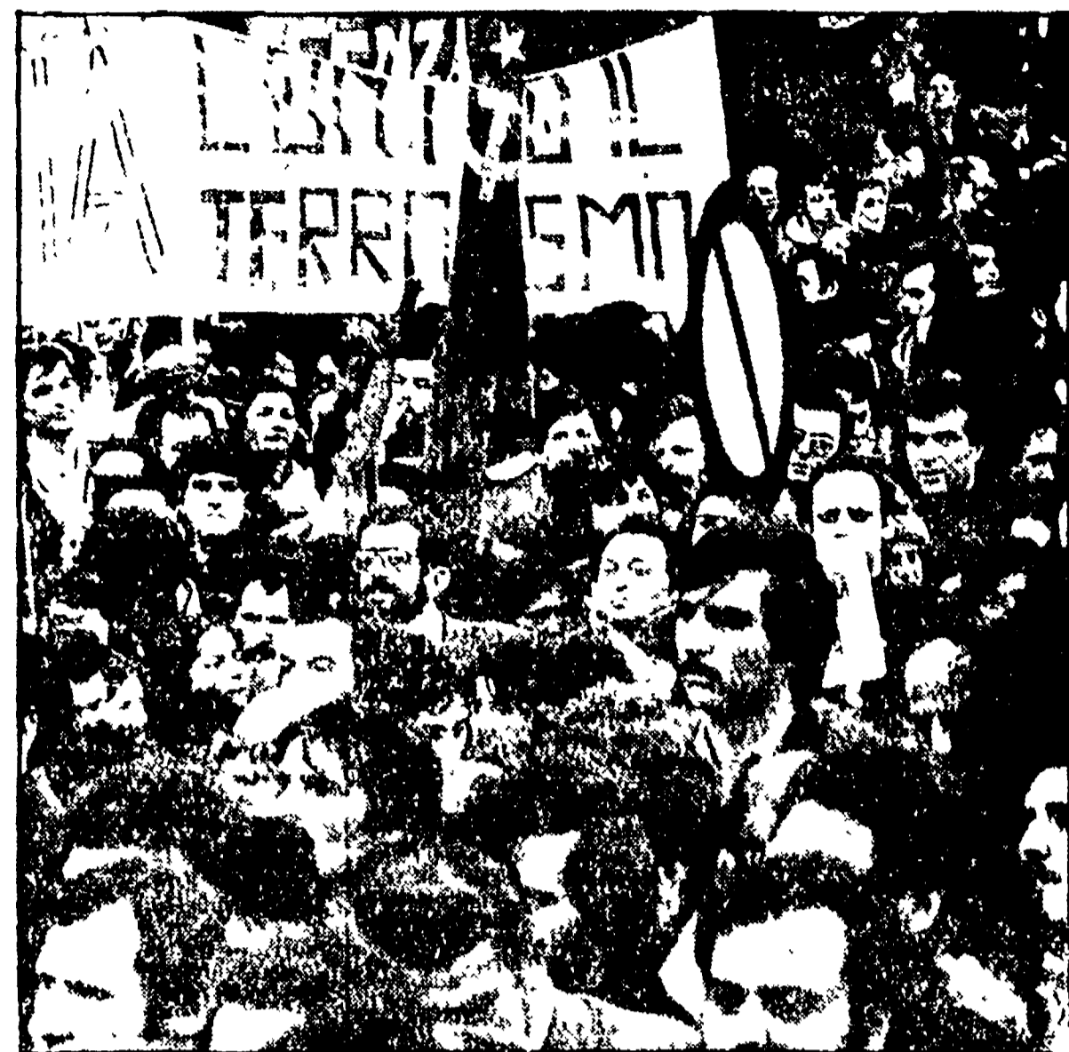
A Santuri Stato il concentramento principale

I più significativi appuntamenti di mobilitazione e di lotta sono dati dalla capillare iniziativa delle forze politiche in Sardegna a Santuri Stato per la prima volta i contadini di una azienda agricola celebreranno la ricorrenza del 25 aprile nei campi dell'azienda agricola a Campobasso il consiglio comunale si riunirà in seduta solenne, a Potenza il consiglio comunale, il consiglio provinciale e il consiglio regionale si riuniranno congiuntamente in seduta pubblica.