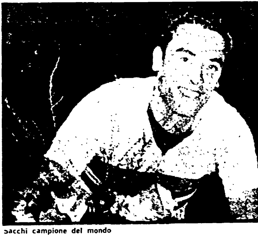
Sacchi campione del mondo

«Il tempo è ormai ripieno di buio e il concorso all'ultima giornata della riunione è davvero numeroso. Il patre sono affollate le tribune: si notano molte signore. La fanfara del 3. Cavalleria Savoia...» Iniziava così, su un giornale del lontano 1900, il resoconto di una corsa ciclistica organizzata dal «Club Sportivo Firenze».