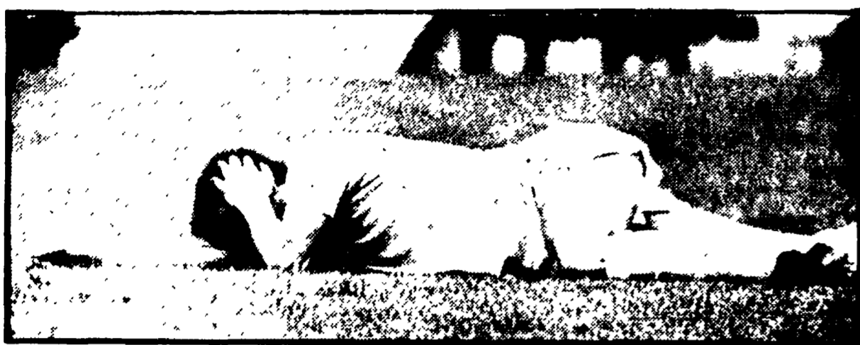
Ghedina a terra sotto choc per il petardo

Il « caso Baresi » risolto: resta il 4-2 per l'Inter