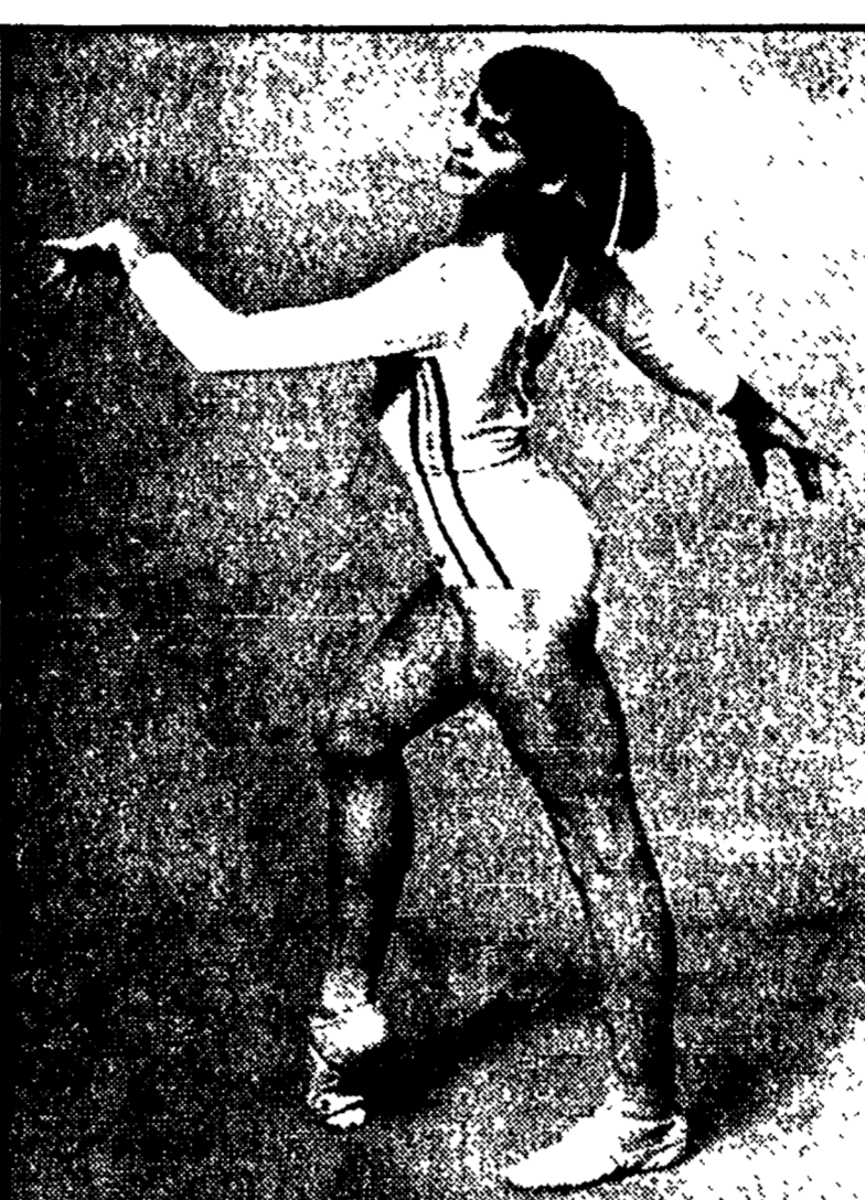
Italia-Romania di ginnastica (TV ore 15)

Oggi pomeriggio al Palazzetto dello Sport (ore 15) si svolgerà l'incontro di ginnastica femminile Italia-Romania.