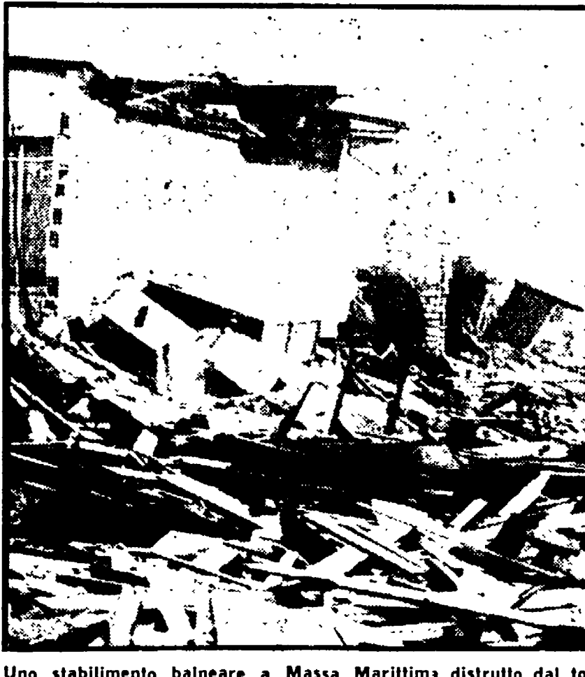
Uno stabilimento balneare a Massa Marittima distrutto dal tornado

MASSA - Si è risolta in poche ore la questione che i lavoratori assunti dalla amministrazione comunale, con un contratto a termine, per il ripristino delle zone colpite dal tornado del 28 agosto del '77, avevano posto rivendicando il pieno rispetto del contratto di assunzione.