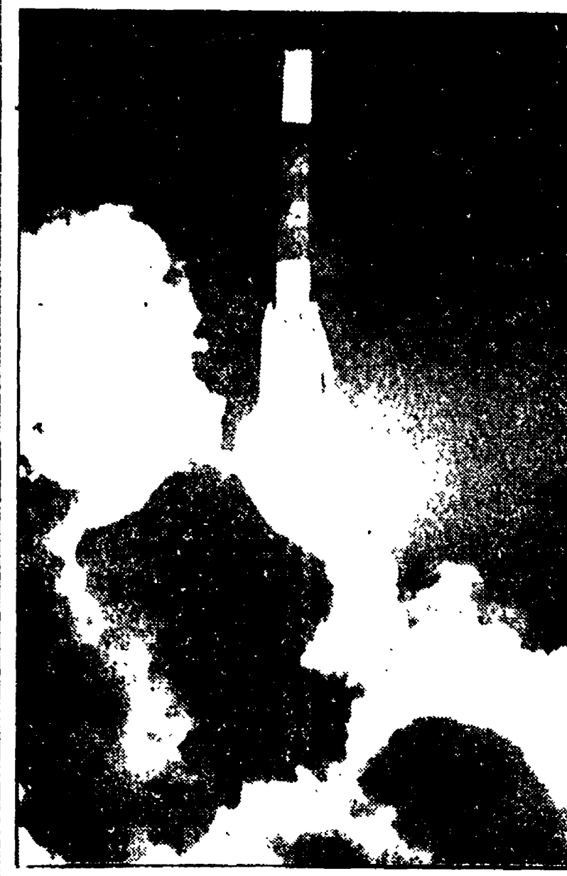
Il fallito lancio dell'OTS a Cape Canaveral nel settembre del '77

Servono a conoscere l'esatta posizione nello spazio della navicella rispetto alla Terra e al Sole. Sono scatole leggere della strumentazione d'avanguardia - Uno specchietto che oscilla per 7 anni