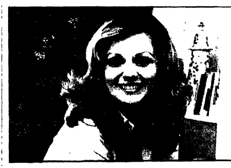
Beba Loncar in « Settimo anno » (Rete 2, ore 20,40)

Ore 10: Messa; 13:30: Telegiornale; 14: Telegiornale per voi; 15: Tarzan e il coccodrillo bianco; 16:05: Ciclismo - Giro d'Italia; 16:40: Tradizioni in fiore; 17:30: Campionati mondiali di hockey su ghiaccio; 18: Giro d'Italia;