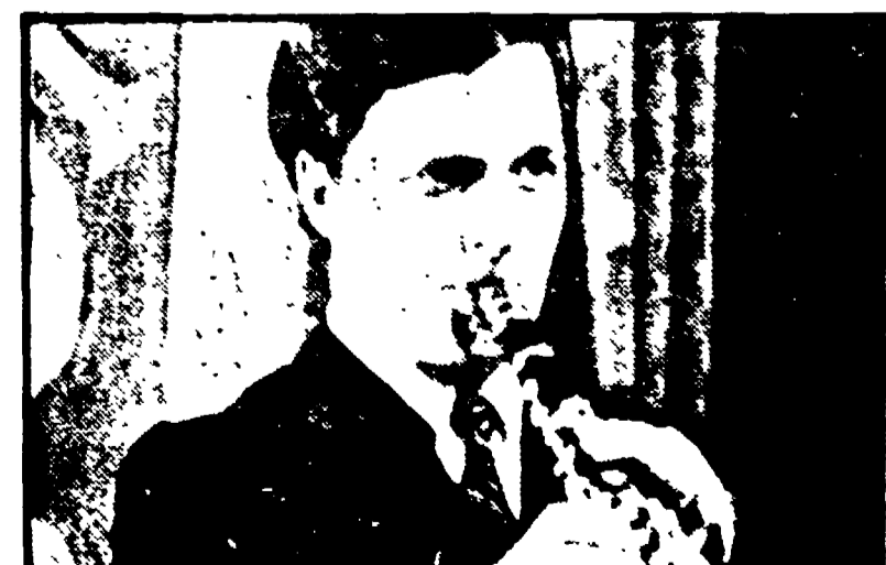
Lino Capolicchio è tra gli interpreti di « Jazz band » (Rete 1, ore 20,40)