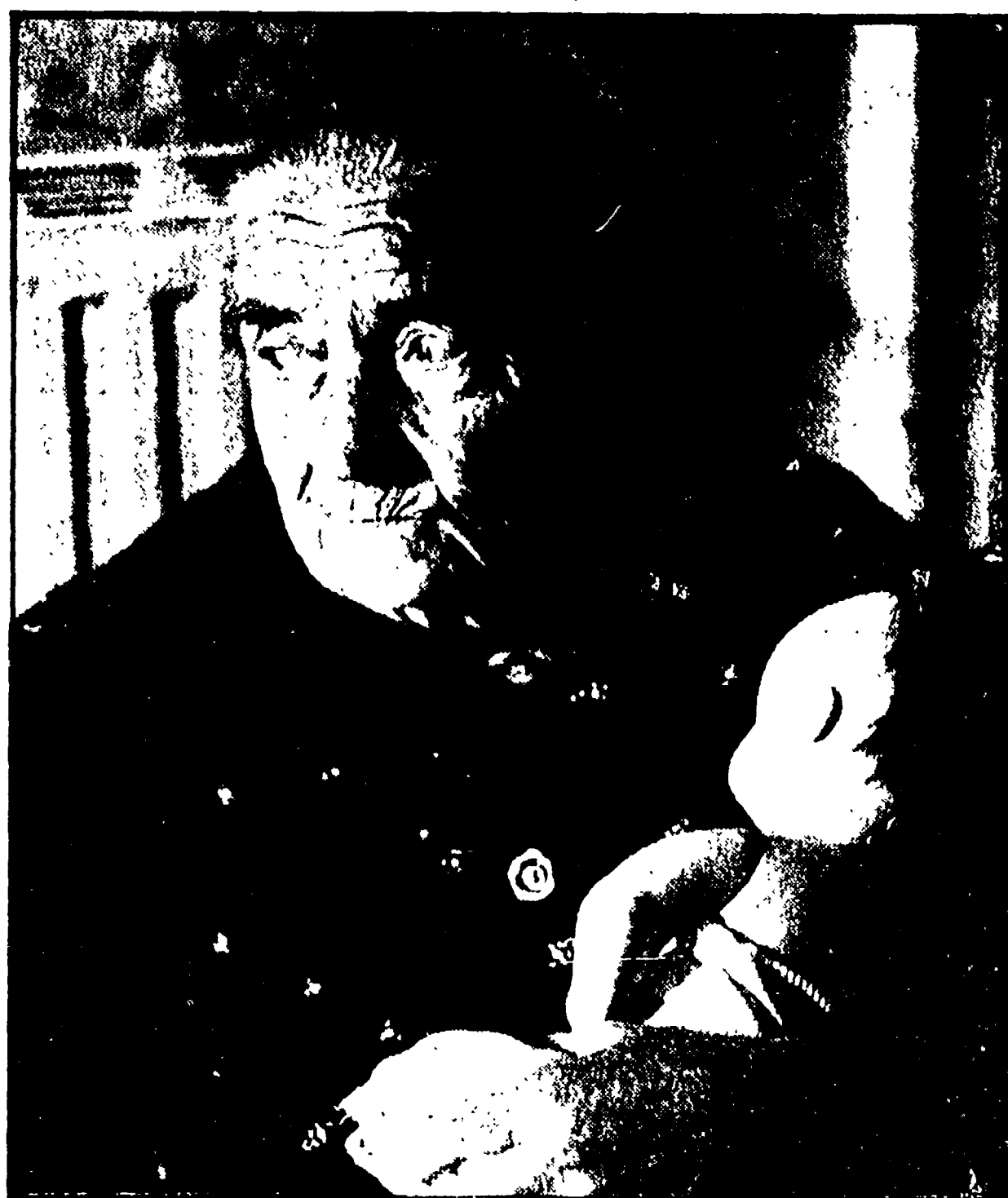
ROMA - «E' mio figlio, lasciatelo...» ha mormorato l'anziana signora ricoverata nel casolare-cronario, stringendo a sé la bambola che non abbandonava mai. E' l'imagine più umana, scalfita dopo l'irruzione nel ricovero dove altre foto, più tremende, più spietate, testimoniano delle orrende condizioni in cui vivevano i vecchi «assistiti» da «Villa Lucia»...